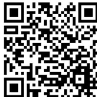
連合徳島青年委員会 Facebookページ