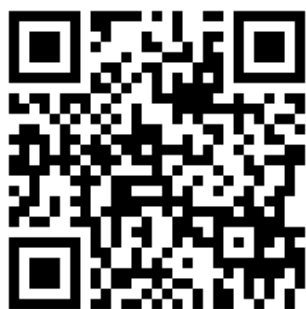
連合徳島HP活動報告等 (NEWS他の資料を掲載)

連合徳島HPおよびFacebook ページのQRコードを添付しておきますので、ぜひご一読ください。当該ページのフォロー、更新を気に掛けていただけましたら幸いです。