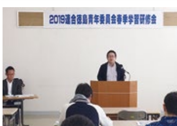
島事務局長が連合ビジョン&運動強化説明

織・財政のあり方についてより具体的な対応方向を打ち出す必要がある」と述べ、連合ビジョン（素案）および連合運動強化特別委員会（中間報告）の内容を説明するとともに、連合結成30周年を契機に全国の構成組織と地方連合会が連携して総対話活動を行って