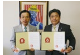
◀中小企業家同友会