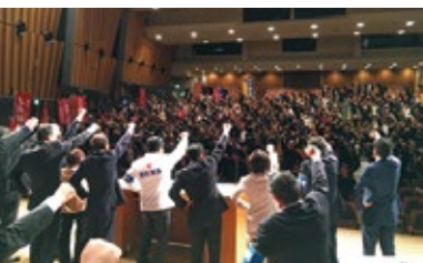
春闘勝利&統一地方選挙必勝に向け、団結ガンパロー

すべての労働者の賃金を「働きの価値に見合った水準」へ引き上げる闘争を展開する」と挨拶。 続いて、島共闘会議事務局長から「発足総会で確認された2019春季生活闘争方針に基づき山場を迎える大手の交渉を支援するとともに、①賃金の『上げ幅』のみならず『賃金水準』を追求する闘争の強化②『すべての労働者の立場にたつ