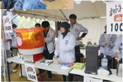
▶参加者で賑わう綿菓子出店

県民と働く者の徳島フェスタ実行委員会、連合徳島、徳島県春闘共闘会議は2019年3月10日、あすたむらんど徳島で、2019 Syuntoふれあいファミリーデーを開催した。