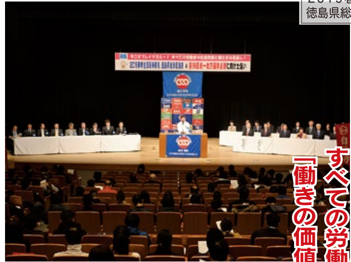
森本共闘会議議長があいさつ