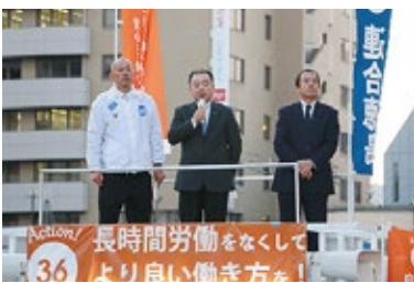
県民に訴える弁士ら

「クラシノソコアゲ応援団! RENGOKYカンパイン」徳島駅前街宣行動を2019年3月12日にJR徳島駅前で行い、各構成組織から30人が参加し、街頭宣伝・ピラ配布を行った。 冒頭、連合徳島森本会長から「政府は、厚生労働省による不適切な毎月勤労統計調査の問題に対応するため、2019年度政府予算案の一般会計を修正し、追加給付に必要な国庫負担分の6.5億円を上積みすることを閣議決定した。2004年以降の毎月勤労統計調査を本来とは異なる手法