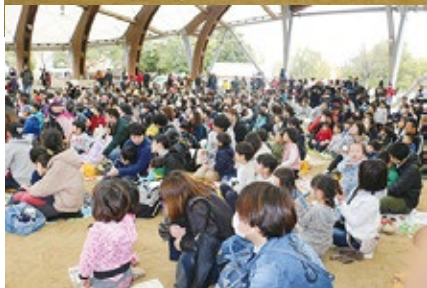
▲組合員や家族など約824人が参加