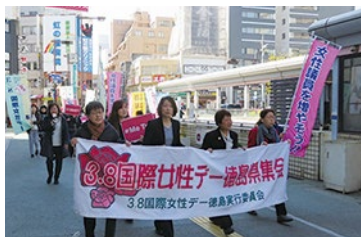
JR徳島駅前アピールウォーク

「ロー針盤」となる運動と政策の方向性を検討し、連合ビジョン『働くことを軸とする安心社会—まもる・つなぐ・生み出す—』を策定する。また、連合運動強化特別委員会は、これまでの各節目において提言し運動を推進してきた経緯を振り返る。連合を構成する各加盟組合の専従者数の減少、地域の最前線を支える人材の確保、連合本部・構成組織・地方連合会とともに連